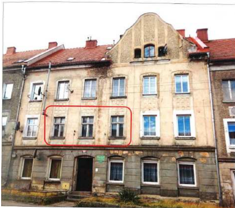
Widok elewacji frontowej – ul. Jarosława Dąbrowskiego.

na sprzedaż lokalu mieszkalnego Nr 4, znajdującego się w budynku położonym w Lubaniu przy ul. Jarosława Dąbrowskiego 20 wraz z udziałem we współwłasności nieruchomości gruntowej (działka nr 77, AM 5, Obręb V o powierzchni 153 m 2 , JG1L/00015719/1)